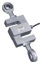
Rotules - Rod end ball joints